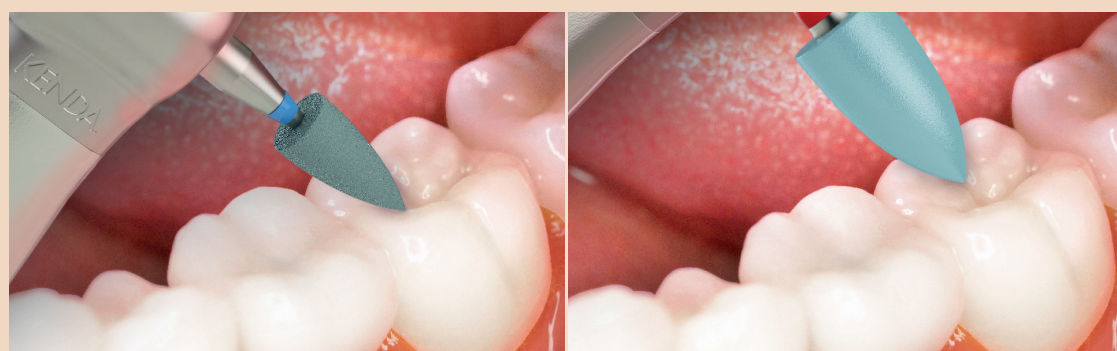
1. Glätten mit REF 0256.

KENDA ZIRCOVIS ist ein harter, robuster und langlebiger Diamantpolierer für die ideale Politur nach dem intraoralen Einschleifen von Restaurationen wie Kronen, Inlays, Onlays und Veneers aus Zirkonoxid. Das Zwei-Schritt-Poliersystem glättet im ersten Schritt raue Oberflächen, im zweiten Schritt entfernt es feine Kratzer und erreicht einen optimalen Hochglanz für natürliche Ästhetik. Die Politur mit KENDA ZIRCOVIS verhindert, dass die natürliche Gegenbezahnung durch