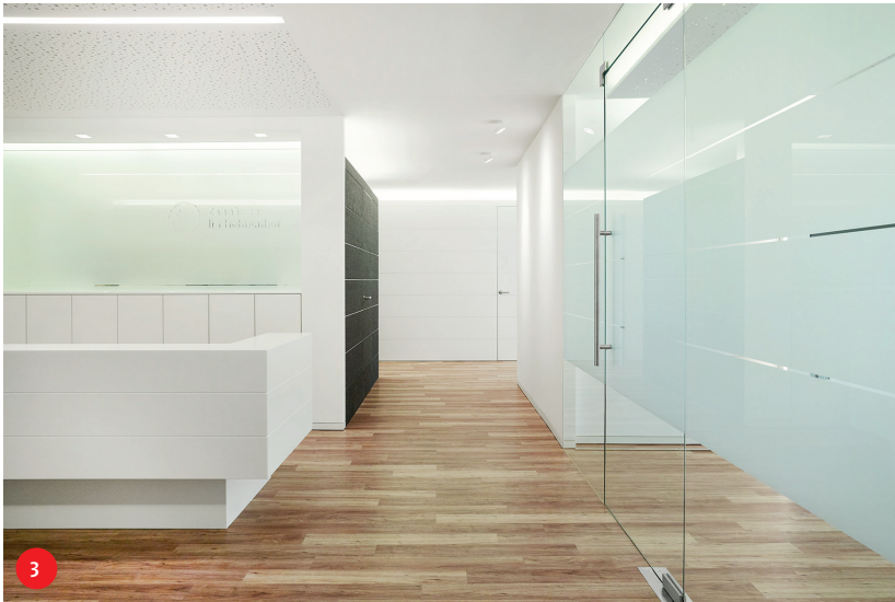
Abb. 3: Die klare Raumflucht mit komplett flächenbündigen Türen leitet den Blick des Betrachters. – Abb. 4: Der Blick ins Wartezimmer zeigt die Kombination aus direkter und indirekter Beleuchtung. – Abb. 5: Indirekte Beleuchtung schafft Atmosphäre.