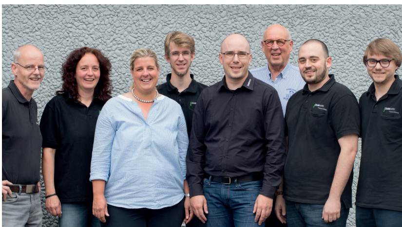
Das ZAHNWERK-Team lädt zum Mitfeiern ein.

Der etablierte CAD/CAM-Dienstleister ZAHNWERK Frästechnik wird 10 Jahre.