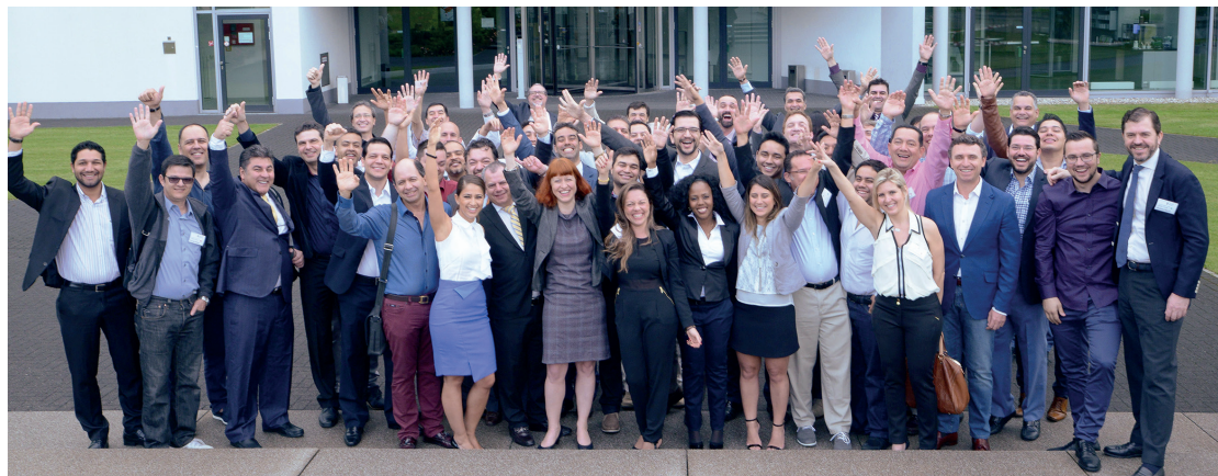
40 Zahnärzte und Zahntechniker aus Lateinamerika durchliefen in einem viertägigen Kurs die Ausbildung zum CEREC- bzw. inLab-Trainer.