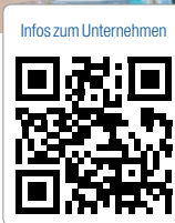
Infos zum Unternehmen

Einfärbung und Eingliederung einer monolithischen Restauration aus Lava™ Plus Zirkoniumoxid werden dabei live anhand eines Patientenfalles demonstriert. Anschließend berichtet ZTM Hans-