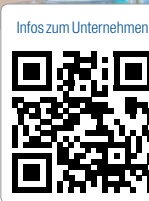
Infos zum Unternehmen