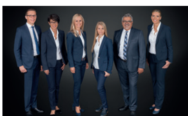
Die Endo-Fachberater von Komet.

Der neue Anspruch der Marke Komet im Endo-Segment wird auf den id infotagen dental München kaum zu übersehen sein. Dafür sorgt ein frischer Messeauftritt, der dazu animiert, sich auf ein interessantes Fachgespräch am Komet Endo-Stand einzufinden. Das Gesamtkonzept hinter Komets neuer Endo-Power heißt Endoneering. Der Begriff steht für den Anspruch, alles zu bieten, was dem Zahnarzt einen effizienten und unkomplizierten Endo-Alltag auf höchstem Niveau ermöglicht. Also für Präzision, Einfachheit, Qualität und den unübertroffenen Komet-Service mit eigenen Endo-Fachberatern.