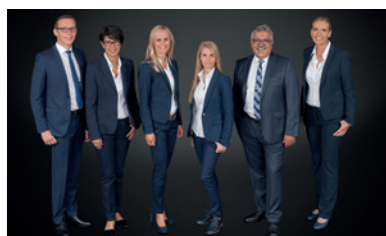
Die Endo-Fachberater von Komet.

Der neue Anspruch der Marke Komet im Endo-Segment wird auf den id infotagen dental München kaum zu übersehen sein. Dafür sorgt ein frischer Messeauftritt, der dazu animiert, sich auf ein interessantes Fachgespräch am Komet Endo-Stand einzufinden. Das Gesamtkonzept hinter Komets neuer Endo-Power heißt Endoneering. Der Begriff steht für den Anspruch, alles zu bieten, was dem Zahnarzt einen effizienten und unkomplizierten Endo-Alltag auf höchstem Niveau ermöglicht. Also für Präzision, Einfachheit, Qualität und den unübertroffenen Komet-Service mit eigenen Endo-Fachberatern.