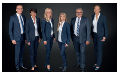
Die Endo-Fachberater von Komet.

Der neue Anspruch der Marke Komet im Endo-Segment wird auf den id infotagen dental München kaum zu übersehen sein. Dafür sorgt ein frischer Messeauftritt, der dazu animiert, sich auf ein interessantes Fachgespräch am Komet Endo-Stand einzufinden. Das Gesamtkonzept hinter Komets neuer Endo-Power heißt Endoneering. Der Begriff steht für den Anspruch, alles zu bieten, was dem Zahnarzt einen effizienten und unkomplizierten Endo-Alltag auf höchstem Niveau ermöglicht. Also für Präzision, Einfachheit, Qualität und den unübertroffenen Komet-Service mit eigenen Endo-Fachberatern.