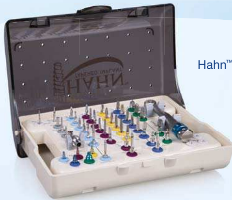
Hahn™ Tapered Implant Chirurgie-Kit