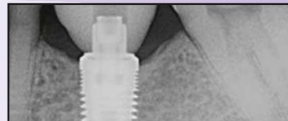
18 Monate nach der Platzierung