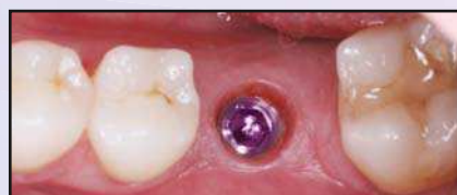
Drei Monate nach der Implantatplatzierung