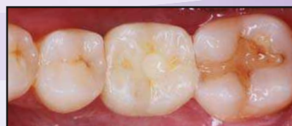
Einsetzen der endgültigen BruxZir® Krone