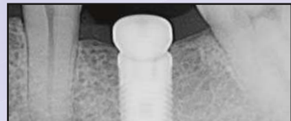
Röntgenaufnahme nach der Platzierung