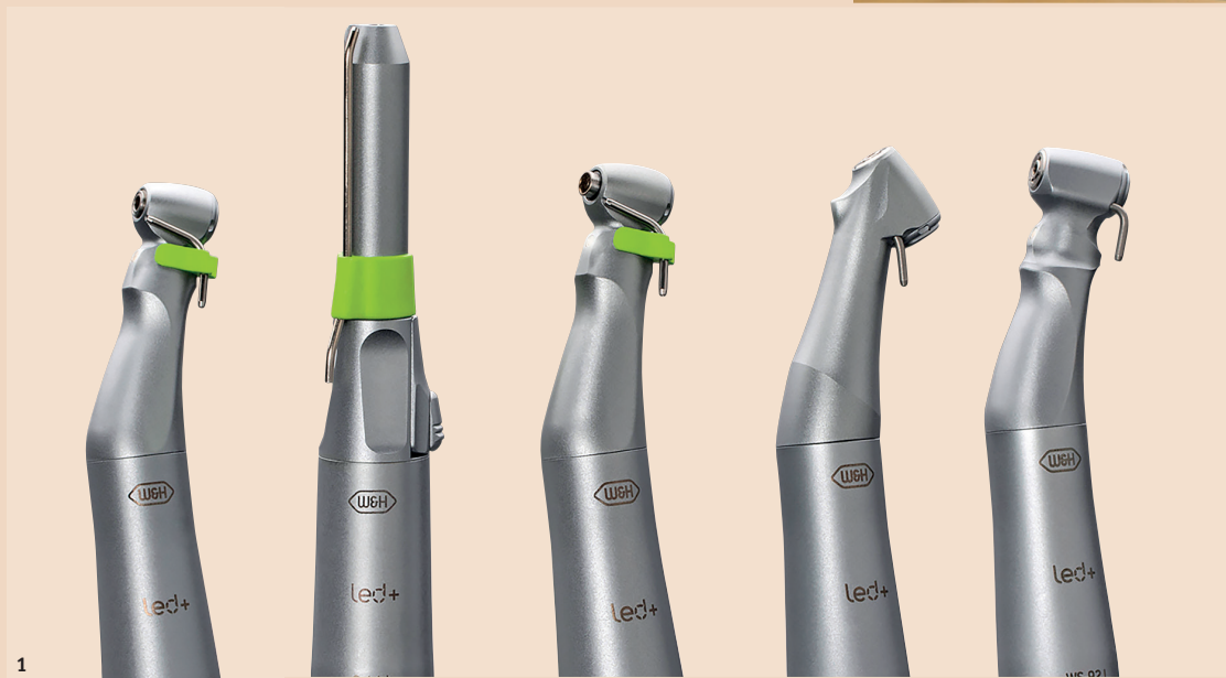
Abb. 1: Die neuen Hand- und Winkelstücke unterstützen den Chirurgen selbst bei schwierigsten Aufgaben. – Abb. 2: Das neue Implantmed von W&H – Innovation auf höchstem Niveau.

des W&H Osstell ISQ-Moduls*, das zur Messung der Implantatstabilität dient, profitieren Anwender von noch mehr Sicherheit in der Bewertung der Osseointegration.