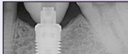
18 Monate nach der Platzierung