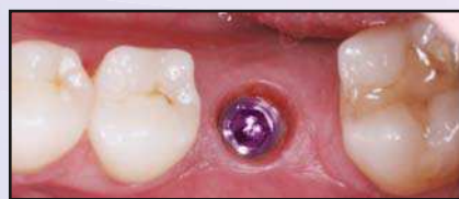
Drei Monate nach der Implantatplatzierung