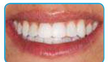
Nach der Applikation von Enamelast