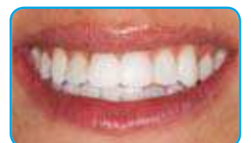
Nach der Applikation von Enamelast