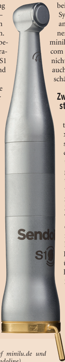
Das Endodontie-System S1 von Sendoline – exklusiv auf minilu.de und DENTALMAN.com .

Durch die einfache Handhabung garantiert das Endodontie-System von Sendoline kürzere Behandlungszeiten und einen verbesserten Ar-