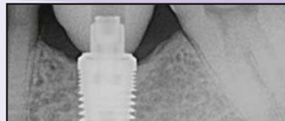
18 Monate nach der Platzierung