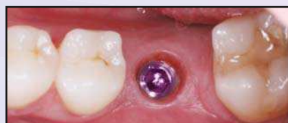
Drei Monate nach der Implantatplatzierung