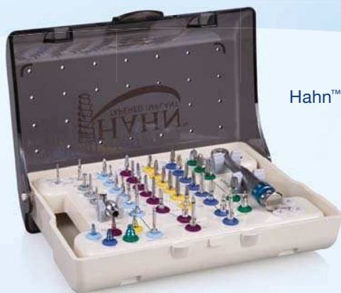
Hahn™ Tapered Implant Chirurgie-Kit