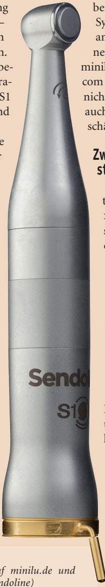
Das Endodontie-System S1 von Sendoline – exklusiv auf minilu.de und DENTALMAN.com .

Durch die einfache Handhabung garantiert das Endodontie-System von Sendoline kürzere Behandlungszeiten und einen verbesserten Ar-