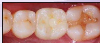
Einsetzen der endgültigen BruxZir® Krone