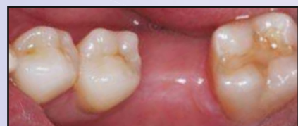
Zahnloser Bereich bei Zahn 19