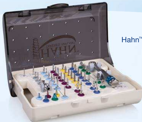
Hahn™ Tapered Implant Chirurgie-Kit