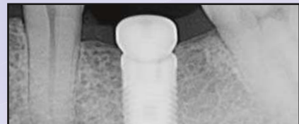
Röntgenaufnahme nach der Platzierung