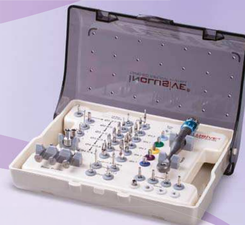
Inclusive® Konus-Implantat-Kit mit chirurgischen Instrumenten

Inclusive ist eine eingetragene Marke von Prismatic Dentalcraft, Inc.