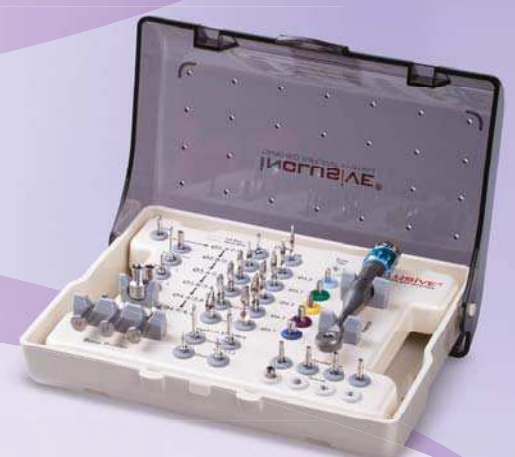
Inclusive® Konus-Implantat-Kit mit chirurgischen Instrumenten

Inclusive ist eine eingetragene Marke von Prismatic Dentalcraft, Inc.