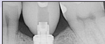
Sechs Monate nach der Implantatplatzierung