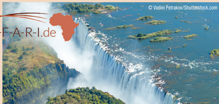
Die Victoriafälle zählen zum Weltkulturerbe der UNESCO und sind die breitesten durchgehenden Wasserfälle der Erde. Ein wahrhaft berauschender Anblick.

Kongress „Neue Konzepte in der Zahnheilkunde“ im südlichen Afrika.