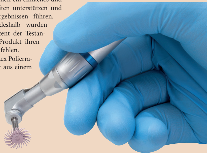
Einfache Anwendung, top Ergebnisse: Das neue Polierräderset von 3M.