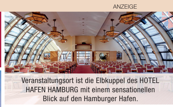
Veranstaltungsort ist die Elbkuppel des HOTEL HAFEN HAMBURG mit einem sensationellen Blick auf den Hamburger Hafen.