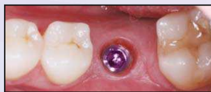
Drei Monate nach der Implantatplatzierung