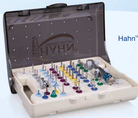
Hahn™ Tapered Implant Chirurgie-Kit