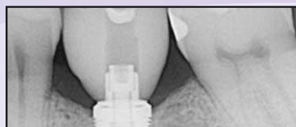
Sechs Monate nach der Implantatplatzierung