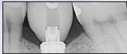
Sechs Monate nach der Implantatplatzierung