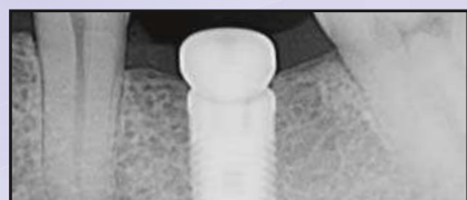
Röntgenaufnahme nach der Platzierung