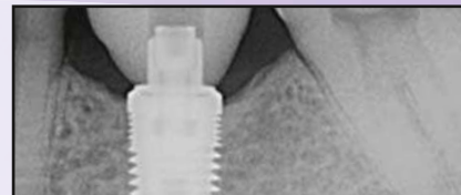
18 Monate nach der Platzierung