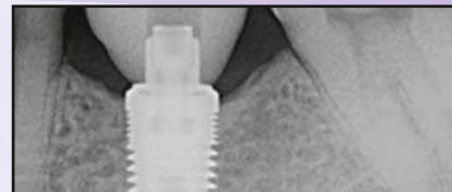
18 Monate nach der Platzierung