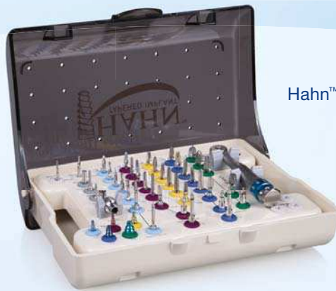
Hahn™ Tapered Implant Chirurgie-Kit