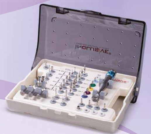
Inclusive® Konus-Implantat-Kit mit chirurgischen Instrumenten

Inclusive ist eine eingetragene Marke von Prismatic Dentalcraft, Inc.