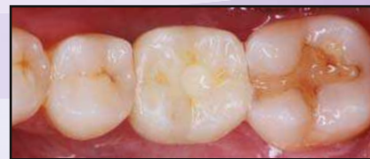
Einsetzen der endgültigen BruxZir® Krone