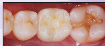
Einsetzen der endgültigen BruxZir® Krone