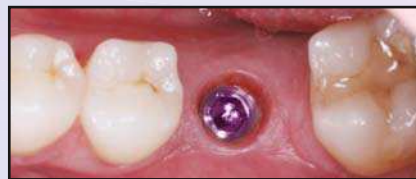
Drei Monate nach der Implantatplatzierung