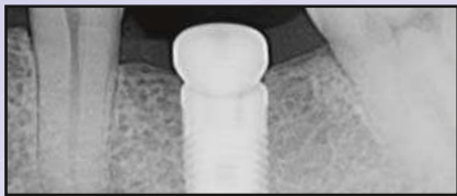
Röntgenaufnahme nach der Platzierung