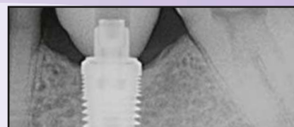
18 Monate nach der Platzierung