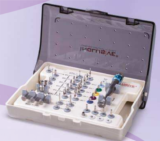
Inclusive® Konus-Implantat-Kit mit chirurgischen Instrumenten

Inclusive ist eine eingetragene Marke von Prismatic Dentalcraft, Inc.