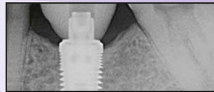
18 Monate nach der Platzierung