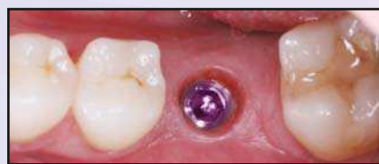
Drei Monate nach der Implantatplatzierung