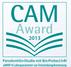
aMMP-8 - Parodontitis-Studie 2011, Universität Jena