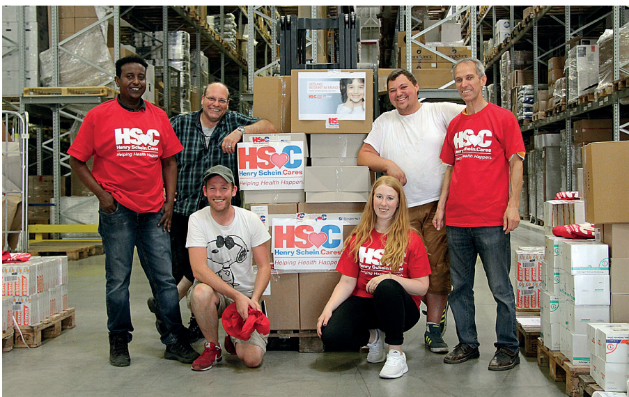
Mitarbeiter im Logistikzentrum von Henry Schein unterstützen das Engagement des Unternehmens und zeigen beim Versand der Spende besonderen Einsatz.

Empfänger der Sachspenden sind in erster Linie „Regionale Arbeitsgemeinschaften Zahngesundheit“. Aber auch Vereine wie das Hilfswerk Zahnmedizin Bayern oder die Grünhelme e.V. sowie einzelne Zahnärzte, die mit größeren Organisationen wie dem Malteser Hilfsdienst kooperieren, haben in diesem Rahmen umfangreiche Spendenmaterialien erhalten. Das Projekt wurde in Kooperation mit der Bundeszahnärztekammer (BZÄK) umgesetzt, die Henry Schein bei der Vorbereitung mit einer Bedarfsabfrage in den Ländern unterstützte.