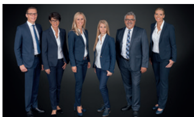
Die Endo-Fachberater von Komet.

Der neue Anspruch der Marke Komet im Endo-Segment wird auf der Fachdental Südwest kaum zu übersehen sein. Dafür sorgt ein frischer Messeauftritt, der dazu animiert, sich auf ein interessantes Fachgespräch am Komet Endo-Stand einzufinden. Das Gesamtkonzept hinter Komets neuer Endo-Power heißt Endoneering. Der Begriff steht für den Anspruch, alles zu bieten, was dem Zahnarzt einen effizienten und unkomplizierten Endo-Alltag auf höchstem Niveau ermöglicht. Also für Präzision, Einfachheit, Qualität und den unübertroffenen Komet-Service mit eigenen Endo-Fachberatern.