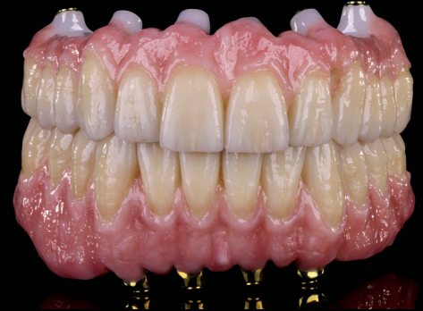
Prettau® Bridge im Oberkiefer auf 6 Implantaten und Unterkiefer auf anodisiertem Titansteg