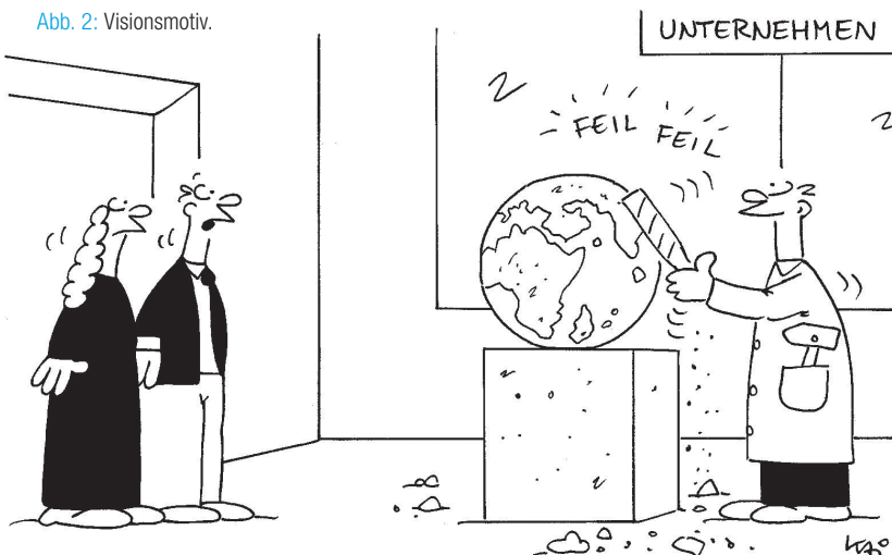
Abb. 2: Visionsmotiv.

„Unser Visionär will mal wieder die Welt verbessern...“