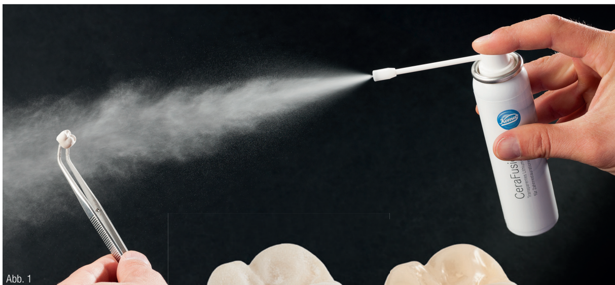
Abb. 1: CeraFusion wird dünn auf die monolithische Zirkonoxidrestauration gesprüht.

MATERIALIEN Die Vorteile einer monolithischen Zirkonoxidrestauration sind Effizienz und Wirtschaftlichkeit. Mit der transparenten Lithiumsilikat-Glaskeramik CeraFusion (Komet Dental) steht Zahntechnikern der Weg offen, die Restauration nach dem Sintern einfach und sicher fertigzustellen. So die Theorie. Doch was sagen die Anwender? Wir haben uns umgehört!