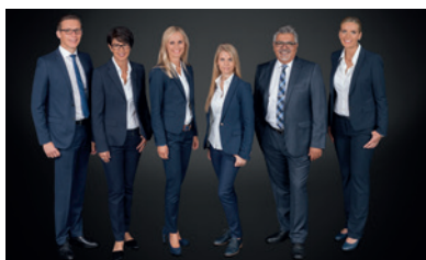
Die Endo-Fachberater von Komet.

Der neue Anspruch der Marke Komet im Endo-Segment wird auf der Fachdental Südwest kaum zu übersehen sein. Dafür sorgt ein frischer Messeauftritt, der dazu animiert, sich auf ein interessantes Fachgespräch am Komet Endo-Stand einzufinden. Das Gesamtkonzept hinter Komets neuer Endo-Power heißt Endoneering. Der Begriff steht für den Anspruch, alles zu bieten, was dem Zahnarzt einen effizienten und unkomplizierten Endo-Alltag auf höchstem Niveau ermöglicht. Also für Präzision, Einfachheit, Qualität und den unübertroffenen Komet-Service mit eigenen Endo-Fachberatern.