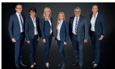
Die Endo-Fachberater von Komet.

Der neue Anspruch der Marke Komet im Endo-Segment wird auf der Fachdental Südwest kaum zu übersehen sein. Dafür sorgt ein frischer Messeauftritt, der dazu animiert, sich auf ein interessantes Fachgespräch am Komet Endo-Stand einzufinden. Das Gesamtkonzept hinter Komets neuer Endo-Power heißt Endoneering. Der Begriff steht für den Anspruch, alles zu bieten, was dem Zahnarzt einen effizienten und unkomplizierten Endo-Alltag auf höchstem Niveau ermöglicht. Also für Präzision, Einfachheit, Qualität und den unübertroffenen Komet-Service mit eigenen Endo-Fachberatern.