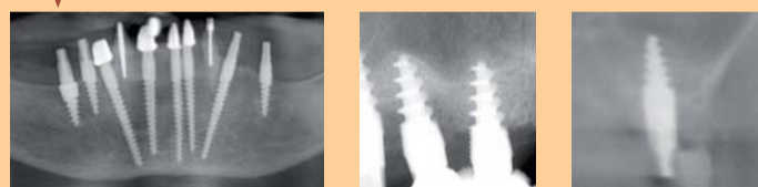
Bsp. 5 & 6: Indirekter Sinuslift (2 Jahre später)