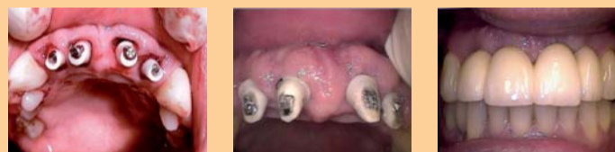
Bsp. 5 & 6: Sofortimplantationen nur zwei Wo. post OP!! Zementierte Zirkon-Prep-Caps für GTR & GBR Gewindelängen von 8 bis 24 mm (alle 2mm)