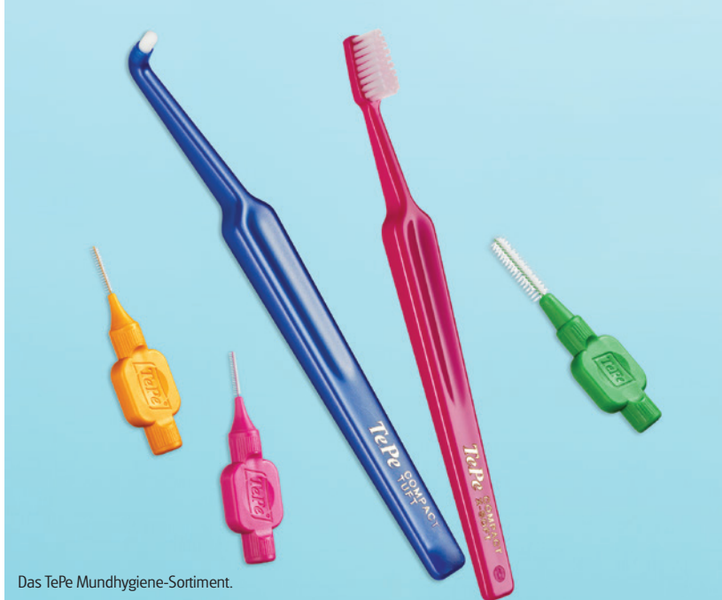
Das TePe Mundhygiene-Sortiment.