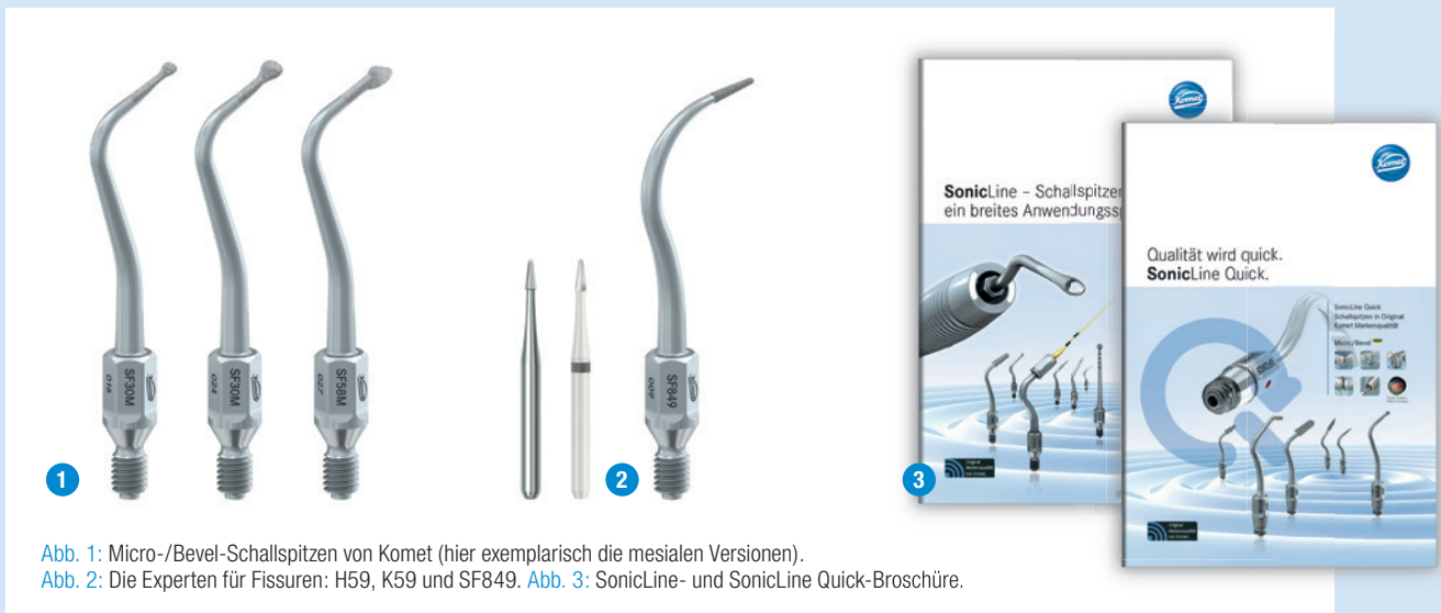
Abb. 1: Micro-/Bevel-Schallspitzen von Komet (hier exemplarisch die mesialen Versionen).