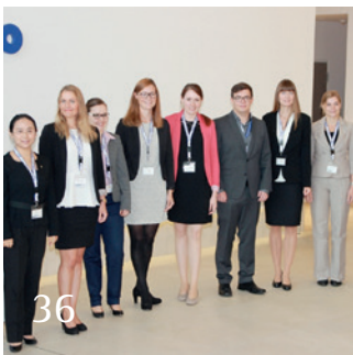
Neugründungen und Steuern – Was ist zu beachten?