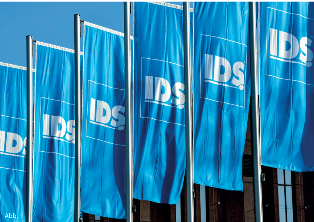
Abb. 1: Die IDS wird vom 21. bis 25. März einen ausführlichen Überblick über aktuelle Entwicklungen im 3-D-Druck liefern.

Beim 3-D-Druck handelt es sich um eine additive Fertigungstechnik – im Gegensatz zu den subtraktiven Verfahren, zum Beispiel zum computergestützten Fräsen oder Schleifen von Vollkeramik oder zum Zerspanen von NEM oder Titan. Dennoch lassen sich viele Analogien entdecken und bei der Erwägung eines eigenen Einstiegs in den 3-D-Druck zurate ziehen.