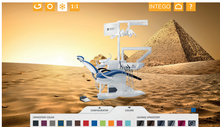
Ob im Wüstensand vor einer Pyramide oder an einem anderen Ort dieser Welt: Mit der ausgezeichneten App werden Behandlungseinheiten lebensecht in das Umfeld eingefügt.

Dentsply Sirona gewinnt für seine Augmented Reality App den Marketing Intelligence and Innovation Award 2016.