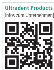
Ultradent Products [Infos zum Unternehmen]

Ultradent Products GmbH Tel.: 02203 3592-0 www.ultradent.com