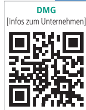
DMG [Infos zum Unternehmen]

Vorsorgen statt Füllen. Zähne erhalten statt Bohren. Für diesen vorbeugenden Ansatz spielt die professionelle Zahnreinigung in der Praxis eine immer wichtigere Rolle. Hier setzt Flairesse von DMG an. Das Prophylaxe-System bietet aufeinander abgestimmte Reinigungspaste, Prophylaxe-Schaum bzw. -Gel und -Lack, allesamt mit Xylit und Fluorid. Das Flairesse-System bietet für jeden Prophylaxe-Schritt einen eigenen „Exper-