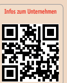
Infos zum Unternehmen

Ultradent Products GmbH Tel.: +49 2203 3592-0 www.ultradent.com