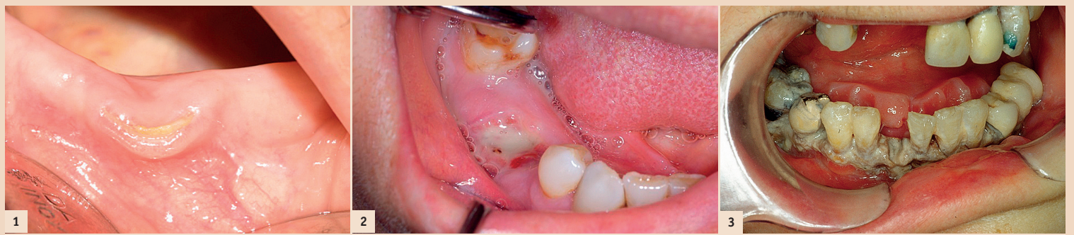
Abb. 1: Bisphosphonat-assoziierte Kiefernekrose im Stadium I: Freiliegender Knochen ohne Entzündungszeichen. – Abb. 2: Bisphosphonat-assoziierte Kiefernekrose im Stadium II: Freiliegender Knochen mit Entzündungszeichen (putride Infektion). – Abb. 3: Ausgedehnte Kiefernekrose mit freiliegendem Knochen und typischerweise nicht umgebenen Alveolen.

Der menschliche Knochen ist kein statisches Gewebe, sondern un-