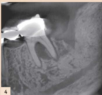
Abb. 4: Radiologisches Zeichen einer Kiefernekrose: Sequesterbildung und nicht verknöcherte Alveole.

Die steigenden Inzidenzen der Medikamenten-induzierten Kiefernekrosen ergeben sich aus dem breiten Einsatzspektrum der Bisphosphonate und RANK-Ligand-Inhibitoren (z.B. Denosumab®) wie bei einer ganzen Reihe an gutartigen und bösartigen Erkrankungen. Bei den bösartigen Erkrankungen wird das osteolytische Wachstum von Knochenmetastasen bei Mamma- und Prostatakarzinom inhibiert. Zum Teil wird auch eine di-