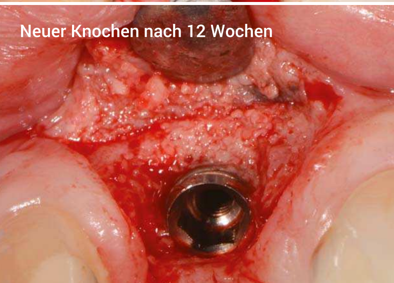
Neuer Knochen nach 12 Wochen