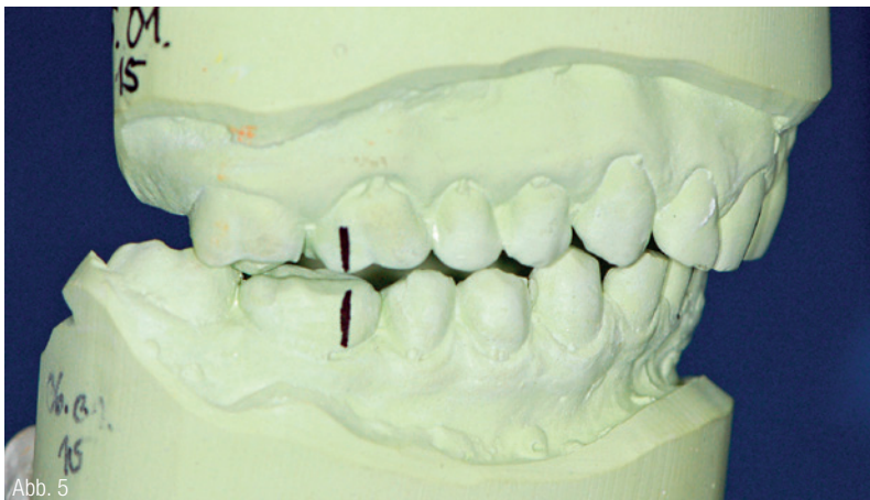
Abb. 4: Habituelle Bissituation. Abb. 5: Bissituation nach Centric Guide Registrierung.