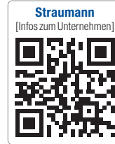
Straumann [Infos zum Unternehmen]

„Ich freue mich sehr auf die neue Aufgabe und die Zusammenarbeit mit meinem neuen Team in Deutschland. Der Fokus wird ganz klar auf Kundenzufriedenheit liegen: Wir werden weiterhin Mediziner und Zahntechniker für Straumann begeistern. Aus meiner Sicht bietet unser Produktportfolio dafür die besten Voraussetzungen: Von der Chirurgie über die Prothetik bis hin zu Biomaterialien bieten wir wissenschaftlich dokumentierte und innovative Lösungen aus einer Hand. Die Einbettung unserer Produkte in effiziente