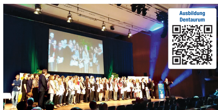
CongressCentrum Pforzheim: Bühne frei für die IHK-Bestenhehrung 2016!

DENTAURUM GmbH & Co. KG Turnstraße 31 75228 Ispringen Tel.: 07231 803-0 Fax: 07231 803-295 info@dentaurum.de www.dentaurum.com