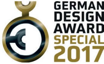
Dentsply Sirona hat den German Design Award 2017 mit der Auszeichnung „Special Mention“ gewonnen.

Arbeiten, wie z. B. die Aufnahme eines Röntgenbildes, Analyse der Bilddaten, Befundung und die Patientenaufklärung, werden durch die Nutzung dieser Software unterstützt. Darüber hinaus können Daten leicht übertragen und beispielsweise an eine Praxisverwaltungssoftware weitergegeben werden. Die „Timeline“-Funktion ordnet alle einem Patienten zugeordneten Bilddaten in einer Preview-Ansicht übersichtlich nach Aufnahme-datum an. Ein schneller Überblick über die Patientenhistorie und das Abrufen der Daten vereinfachen den Alltag des Behandlers. Weiterhin bietet die Compare-Funktion die Möglichkeit, zeitgleich und simultan zwei 3D-Röntgenaufnahmen oder bis zu vier 2D-Bilder zu analysieren und miteinander zu vergleichen. „Ein noch stärkerer Blickwinkel, ganz nah aus der Sicht des (Fach-)