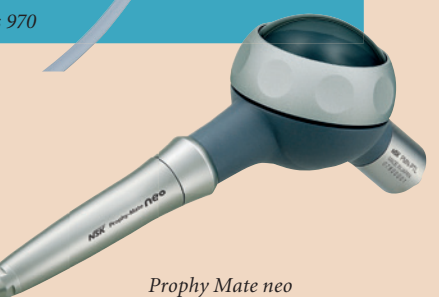
Prophy Mate neo

Uns geht es nicht nur um die Produktion von Gütern, sondern auch um Ideale. Unser Ziel ist es, gemeinsam mit den Menschen in aller Welt neue Werte zu schaffen. Dingen, die es bisher noch nicht gab, verleihen wir eine Form. Wir schaffen Technologien, die jeden in Erstaunen versetzen. Wir bereichern das Leben vieler und zaubern ein Lächeln auf die Gesichter der Menschen. Auch in den vor uns liegenden Jahren werden wir Ihr verlässlicher und kreativer Partner sein. DT