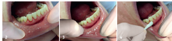
Abb. 2–4: Sofortige Blutstillung mit Hämostatikum Al-Cu.

Bei infektionsgefährdeten Patienten empfiehlt sich auch im Zuge der professionellen Zahnreinigung – vor dem Ausspülen – eine kurze Touchierung mit einem mit Hämostatikum Al-Cu getränkten Wattebausch, um die kleineren Blutungen zu stoppen. Gleichzeitig wird hierbei auch die Keimbelastung reduziert.