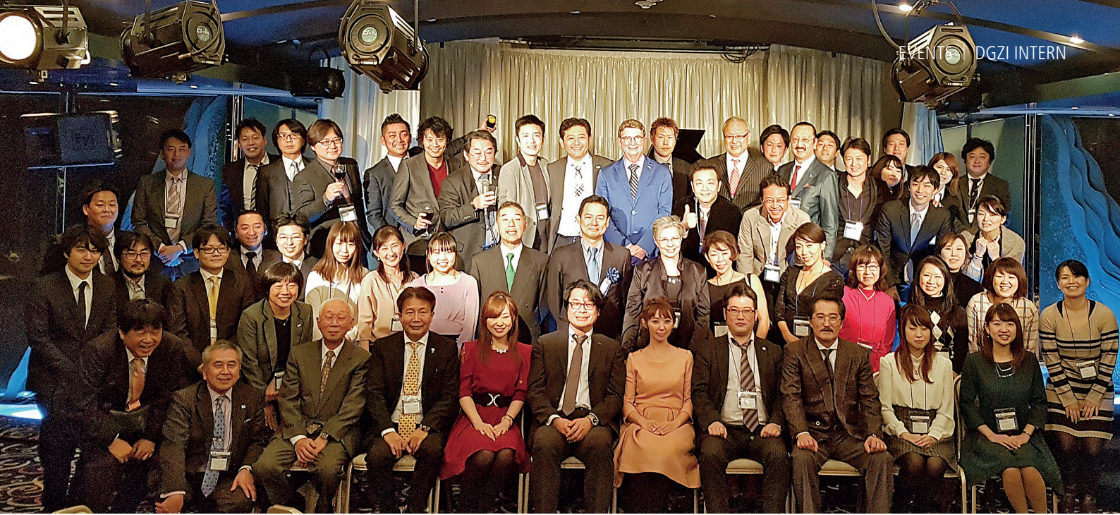
Abb. 1: Teilnehmer des International Society of Oral Implantology Meetings.