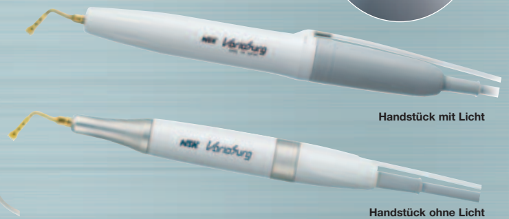
Handstück mit Licht