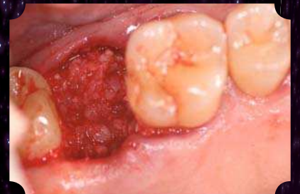
Das eingebrachte Knochenersatzmaterial