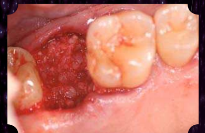
Das eingebrachte Knochenersatzmaterial