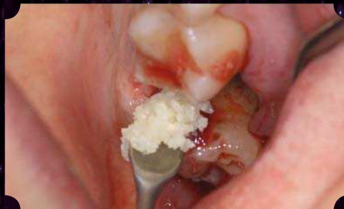
Einbringen des gewonnenen Augmentats