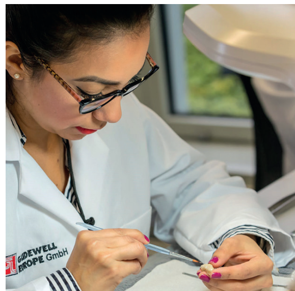
Abb. rechts: Die generelle Umlaufzeit im Labor beträgt fünf Tage, außer bei implantatgetragenen Prothesen. Bei Kronen und Brücken über den digitalen Upload, zum Beispiel von Intraoralscans, beträgt die Bearbeitungszeit nur drei Tage.

Ermöglicht wird die günstige Preispolitik durch das Betreiben des deutschen Meisterlabors in Frankfurt am Main