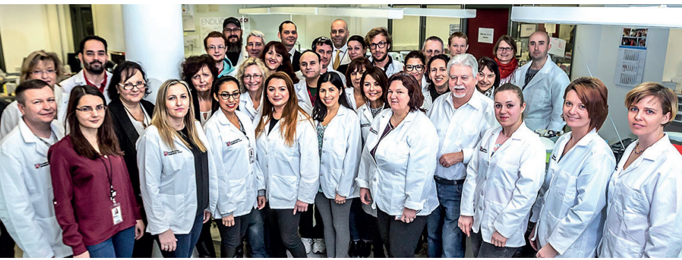
Abb. oben: Das Laborteam am Standort Frankfurt am Main. Über 60 Mitarbeiter sorgen für eine schnelle und kompetente Abwicklung beim Full-Service-Anbieter Glidewell Europe.

strikt nach Industriestandards, durch strenge Qualitätskontrollen und den Einsatz moderner Automatisierungsverfahren für prozessgesteuerte Zahntechnik. Große Stückzahlen in der Produktion erlauben es Glidewell, immer bessere Preise im Einkauf der Materialien zu erreichen, und um die Kosten langfristig zu optimieren, wurde in die Entwicklung eigener Materialien investiert, darunter das zahnfarbene monolithische Zirkonoxid BruxZir®. Die gerade neu eingeführte Lithiumsilikatkeramik Obsidian® ermöglicht eine prozessoptimierte Produktion durch CAD-Design, der CAM-Fertigung in Wachs und dem anschließenden Überpressen des Metalls.