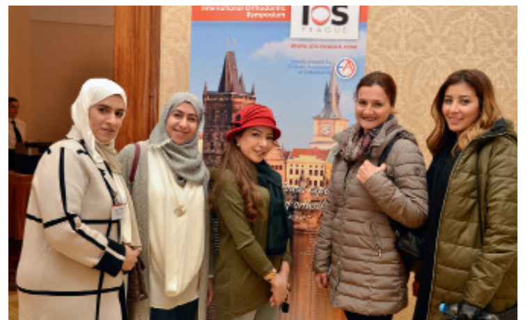
Genossen den IOS in Prag: Kieferorthopädinnen aus den Vereinigten Arabischen Emiraten.