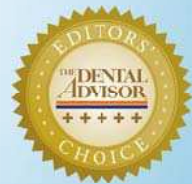
DENTAL DAM CLAMPS WITH ORGANIZER