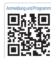
Anmeldung und Programm

OEMUS MEDIA AG Holbeinstrasse 29 04229 Leipzig Tel.: 0341 48474-308 Fax: 0341 48474-290 event@oemus-media.de www.oemus.com www.giornate-romane.info