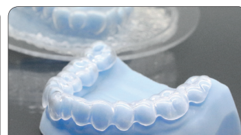
FREEPRINT® model T