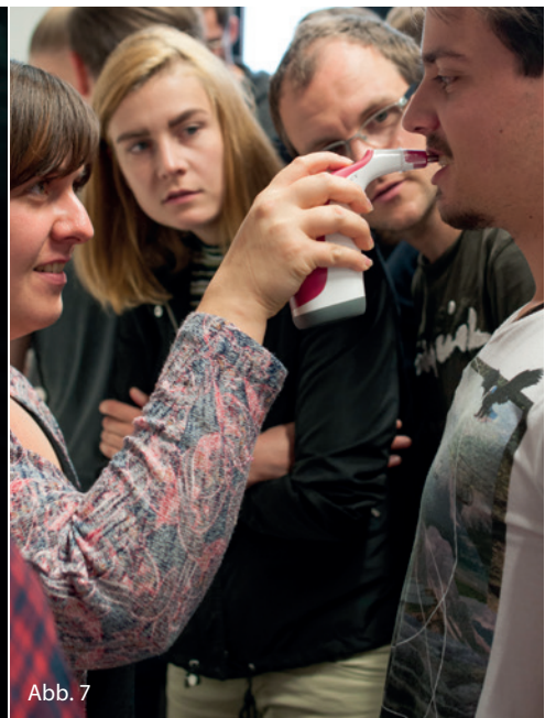
Abb. 5: Die visuelle Zahnfarbbestimmung mit dem VITA Linearguide 3D-MASTER. Abb. 6: Die Kommunikation der Zahnfarbe mit der VITA mobileAssist App trifft den Zeitgeist. Abb. 7: Studierende erlernen den Umgang mit dem VITA Easyshade V.

Didaktisch eröffnet sich die Vergleichsmöglichkeit zwischen der subjektiven, visuellen Farbbestimmung mittels Farbmusterring und dem objektiven spektrofotometrischen Verfahren. Die moderne Menüführung mittels OLED-Farbtouchdisplay und die intuitive Bedienbarkeit des VITA Easyshade V erlauben die präzise und sichere Zahnfarbbestimmung bereits nach kurzer Lernphase. Dabei können die Messergebnisse entsprechend dem VITA SYSTEM 3D-MASTER beziehungsweise dem VITA classical A1–D4 ermittelt werden. Dank der kurzen Messspitze kann selbst an kleinen Zähnen und im Molarenbereich eine 3-Punkt-Messung durchgeführt werden.