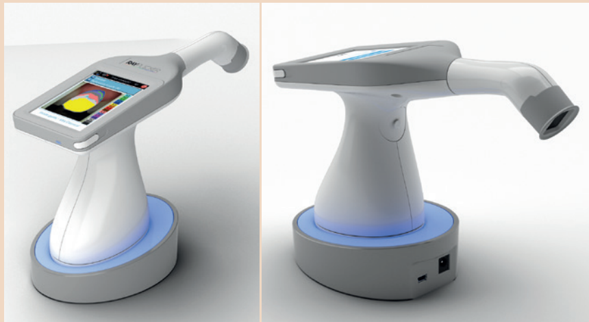
„Rayplicker“ bringt eine innovative und einfache Lösung für die Herstellung von Zahnprothesen. – Durch die „Rayplicker“-Software können Zahnärzte und Zahntechnik-Labore einfacher kommunizieren und dadurch besser, aber vor allem fehlerfreier zusammenarbeiten.

Sie sind herzlich eingeladen, Borea auf dem französischen Gemeinschaftsstand von Business France in Halle 2.2, Stand C043 kennenzulernen. DT