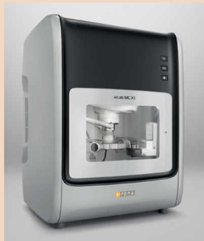
Mehr Fertigungsoption mit der inLab MC X5: Ab sofort lassen sich einteilige individuelle Titanabutments im eigenen Labor fertigen.

Dentsply Sirona CAD/CAM erweitert das Anwendungsspektrum von inLab MC X5.