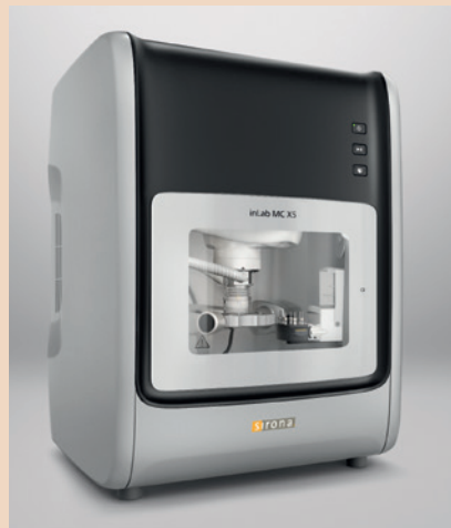
Mehr Fertigungsoption mit der inLab MC X5: Ab sofort lassen sich einteilige individuelle Titanabutments im eigenen Labor fertigen.

Dentsply Sirona CAD/CAM erweitert das Anwendungsspektrum von inLab MC X5.