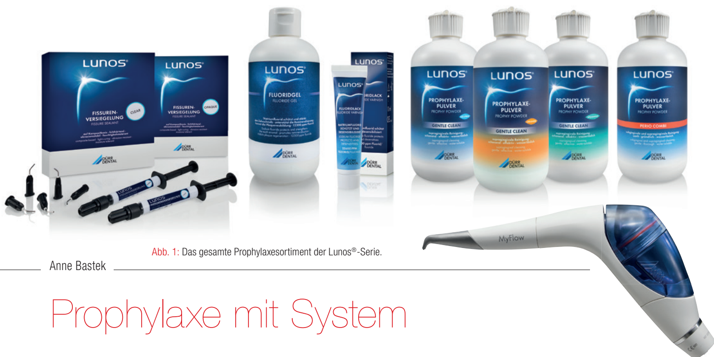
Abb. 1: Das gesamte Prophylaxesortiment der Lunos®-Serie.