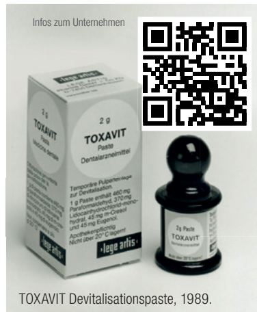
TOXAVIT Devitalisationspaste, 1989.