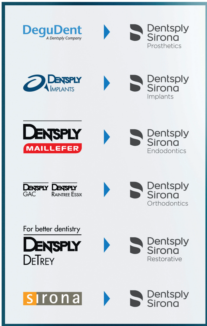
Abb. links: So sind die Geschäftsbereiche von vormals DENTSPLY in die Bereiche von Dentsply Sirona übergegangen. Messebesucher finden diese in Halle 11.2 wieder.

So präsentiert sich die neue Einheit Preventive (Vorsorge) neben dem Bereich Instruments: Hier werden unter anderem Produkte für einen optimalen Hygieneworkflow im Praxisalltag gezeigt. Der Bereich Prosthetics (DENTSPLY DeguDent) befindet sich in direkter Nachbarschaft zu CAD/CAM inLab. Zahntechniker können die Materialien aus dem Hause Dentsply Sirona auf diese Weise direkt in der Verarbeitung der inLab-Maschinen sehen. Dentsply Sirona Implants wird von Ständen der Bereiche Imaging und CAD/CAM umgeben. Die integrierte Implantologie lässt sich so live nachvollziehen: Sie beginnt bei der präzisen 3-D-Bildgebung und der digitalen Abformung, führt über bewährte Implantatplanungsprogramme und klinisch erprobte Implantate hin zur CAD/CAM-gefertigten Bohrschablone und der individuellen prothetischen Versorgung. Dentsply Sirona Endodontics (vormals DENTSPLY Maillefer) ist in direkter Nähe zu den Bereichen Instruments, Vorsorge (Preventive) und Imaging platziert. Auch hier bieten die Daten aus bildgebenden Verfahren die Basis. Passend dazu sind in direkter Nähe die Füllungs- und Restorationsmaterialien aus dem Bereich Restorative (DENTSPLY DeTrey) angeordnet. Sie komplettieren den endodontischen Workflow und sorgen für maximale Behandlungssicherheit.