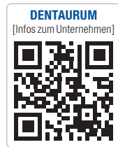
DENTAURUM [Infos zum Unternehmen]