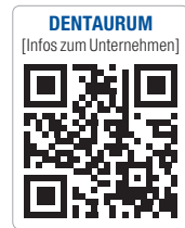
DENTAURUM [Infos zum Unternehmen]