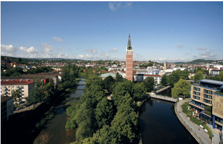
Dieses Datum sollten Kieferorthopäden sich unbedingt vormerken: Vom 21. bis 23. September 2017 findet in Pforzheim das internationale IX. FORESTADENT Symposium statt.

IX. FORESTADENT Symposium wartet mit hochkarätig besetztem Programm auf.