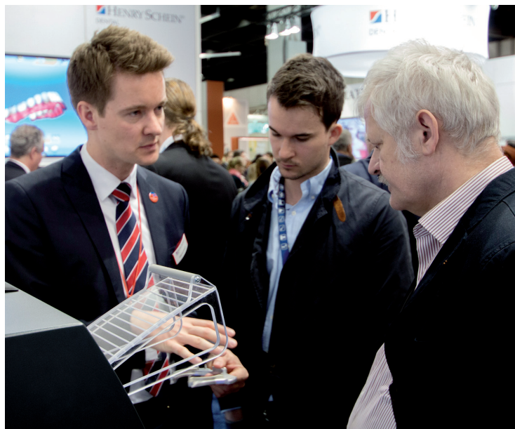
Beliebter Treffpunkt auf der IDS für viele (Fach-)Zahnärzte und Laborinhaber: Der Stand von Henry Schein.

Neu ist bei Henry Schein in diesem Jahr auch das Live-Format „Meet the Experts“. In kompakten Vorträgen geben Spezialisten am Messestand täglich wert-