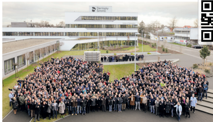
Am Standort von Dentsply Sirona in Bensheim arbeiten rund 1.700 Mitarbeiter, um die Verbesserung der Zahnheilkunde voranzutreiben.

tik wertschätzt. Die Zufriedenheit unserer Mitarbeiter ist uns sehr wichtig, deshalb bieten wir in mehr als 40 Ländern weltweit zahlreiche Aus- und Weiterbildungsmöglichkeiten. Den Top Employer Award sehen wir aber nicht nur als Bestätigung – er ist auch eine Motivation, uns als Arbeitgeber weiterzuentwickeln. Daran arbeiten wir stetig.“ KN