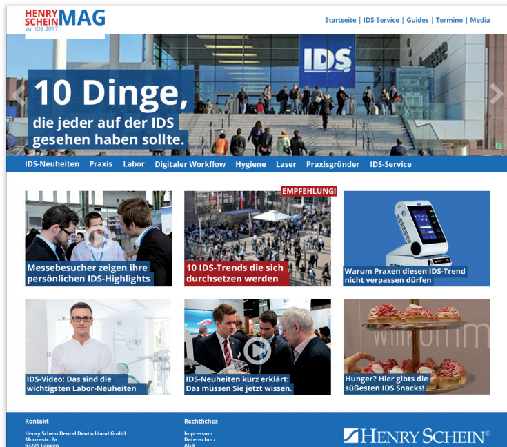
Das Henry Schein MAG informiert Messebesucher und Daheimgebliebene über die wichtigsten dentalen Trends zur IDS.

Nachwuchstalente aus der Zahnmedizin haben auch in diesem Jahr bei Henry Schein eine eigene Anlaufstelle. Am dent.talents.-Stand gibt es neben leckerem Kaffee auch spannende Neuigkeiten für alle, die ihre Zukunft über kurz oder lang in der eigenen Praxis sehen. Neugierige schauen einfach vorbei oder registrieren sich schon jetzt unter www.dentaltalents.de für den Newsletter und bleiben so immer up to date. KN