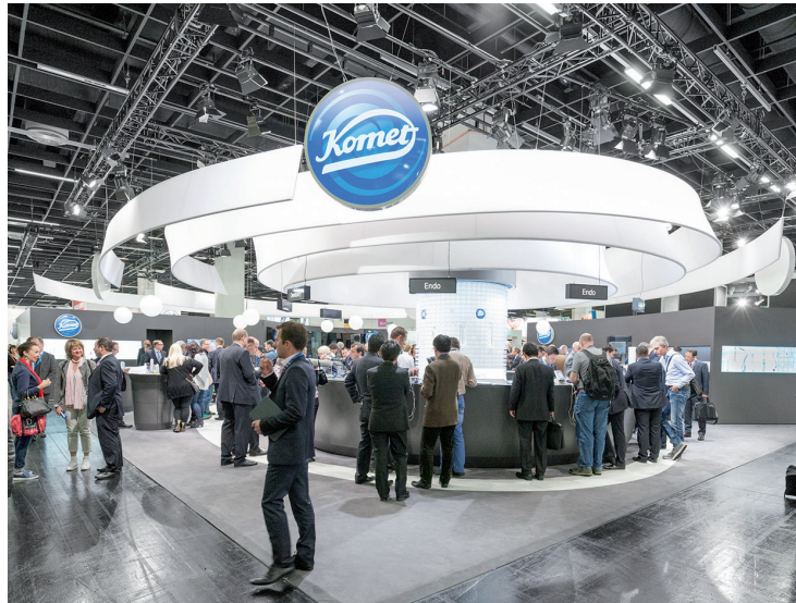
Am Stand von Komet Dental werden Fachleute aus Produktentwicklung und -management während der IDS über neueste Lösungen für Praxis und Labor informieren.

Dental Reality steht für den Markenanspruch, alles zu kennen, zu können und zu bieten, was den Alltag in der Praxis und im Labor präzise, einfach und effizient macht. Von den ausgereiften Standardinstrumenten bis zu innovativen Lösungen, vom persönlichen Service bis zum umfassenden Know-how. Ein Schwerpunkt liegt in diesem Jahr offensichtlich auch auf dem Thema „Endo“. Komet bietet schon seit Langem ein breites Sortiment für den Endo-Einsteiger als auch den Endo-