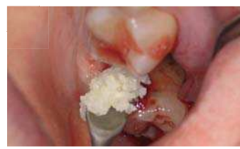
Einbringen des gewonnenen Augmentats

Sehen Sie sich eine Sofort- Implantation (Extraktion und Implantation in einer Sitzung) mit Einsatz des Champions Smart Grinders auf vimeo an