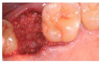
Das eingebrachte Knochenersatzmaterial