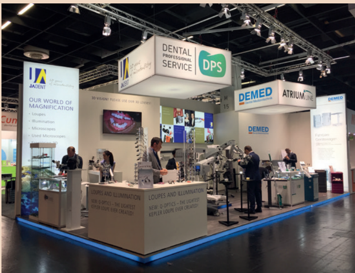
Ruhe vor dem Sturm – letzte Vorbereitungen kurz vor der Eröffnung der IDS 2017.

Q-Optics – Die leichteste Kepler-Lupenbrille, die es je gab! Mit weniger als 60g, mit drei verschiedenen Vergrößerungen (3,5x/4,0x/4,5x) in High Resolution-optik, mit der Titanfassung mit NiTi-Flex-Bügeln und in elf unterschiedlichen modischen Farben.