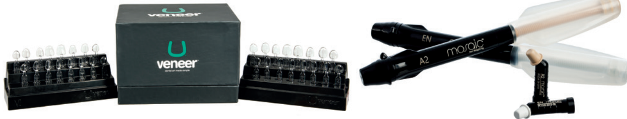
← Anspruchsvolle Kompositrestauration in nur einer Sitzung: Das neue Uvener™.

arbeiten, führt zu optimalen Absorptionen des Laserlichts durch Melanin und Wasser. 20 Watt, supergepult, sorgen für einen sauberen, schnellen Schnitt in Weichgewebe. Insgesamt 19 vorprogrammierte Indikationen