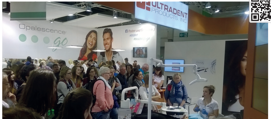
← Großer Andrang am IDS-Stand der Firma Ultradent Products.

Die Farben folgen der VITA-Skala; 20 Farb-Optionen sind verfügbar. Die Farbwahl ist intuitiv und kann einfach oder komplex erfolgen; voraussehbare, natürliche Restaurationen sind das Ergebnis. Der durchdachte