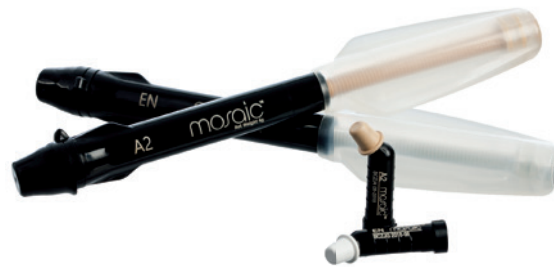
• Mosaic, das neue Nanohybridkomposit.

arbeiten, führt zu optimalen Absorptionen des Laserlichts durch Melanin und Wasser. 20 Watt, supergepulst, sorgen für einen sauberen, schnellen Schnitt in Weichgewebe. Insgesamt 19 vorprogrammierte Indikationen