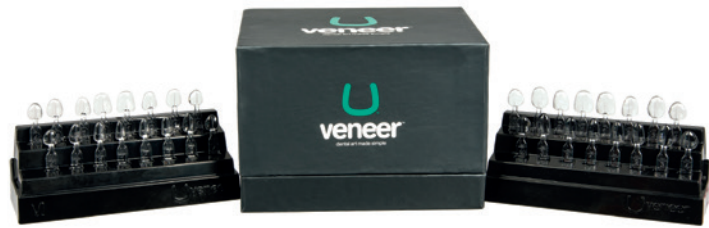
• Anspruchsvolle Kompositrestauration in nur einer Sitzung: Das neue Uvener™.

Neue Uvener™-Formhilfen ermöglichen die Herstellung ästhetisch anspruchsvoller, naturnah gestalteter direkter Kompositrestaurationen innerhalb nur einer Sitzung. Innovative Technologien ermöglichen eine langlebige, zuverlässige und qualitativ hochwertige Restauration im Front- oder sichtbaren Seitenzahnbereich. Dabei zeigt sich Uvener™ flexibel und ist geeignet für die dauerhafte Anwendung im sichtbaren Bereich, aber auch für die Erstellung von Mock-ups oder Provisorien für Keramikverblendungen. Verarbeitet werden können die Uvener™-Formhilfen mit jedem marktüblichen Komposit; ideal ist das neue Komposit