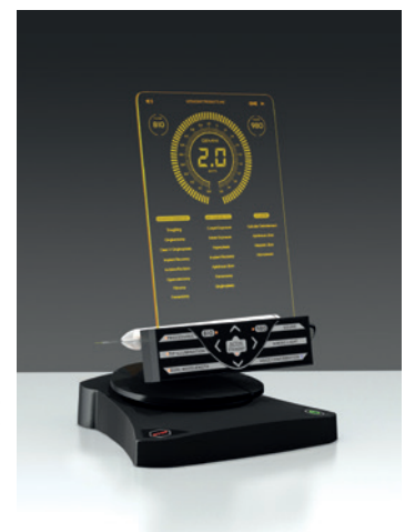
← Minimalinvasiv und leistungsstark: der Gemini™ 810+980 Diodenlaser.

Farbschlüssel aus echtem Komposit unterstützt dabei. Er zeigt nicht nur einzelne Farben, sondern auch Kombinationen aus Dentin- und Schmelzmassen. Ausgedehnte Verarbeitungszeit unter Umgebungslicht steht zur Verfügung.